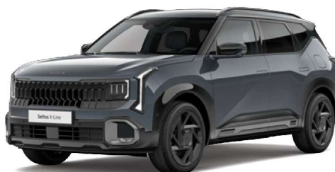
Šedá Interstellar (AGT) Metalická