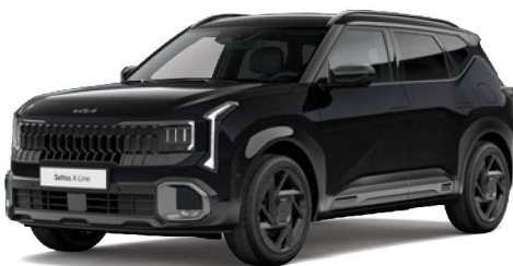
Černá Aurora (ABP) Perleťová