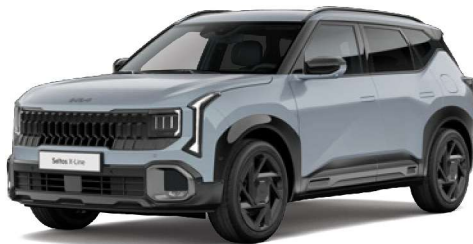
Šedá Pale Ripple (APG) Perleťová