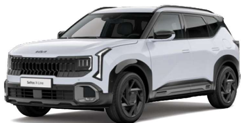
Bílá Snow (SWP) Perleťová