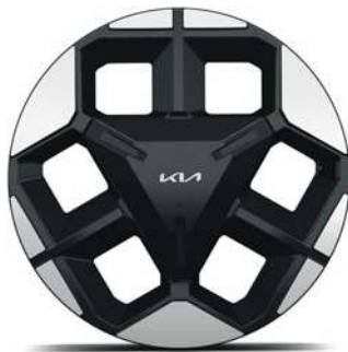
18" hliníkové disky kol s pneumatikami 215/55