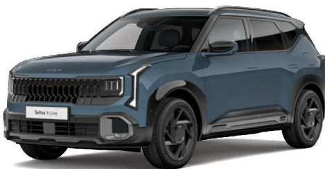
Modrá Denim (DNB) Pastelová