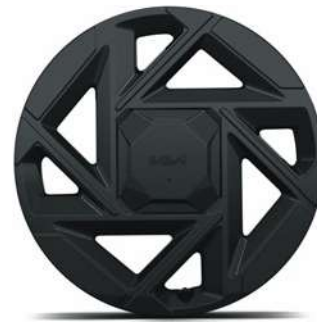
19" hliníkové disky kol s pneumatikami 235/45