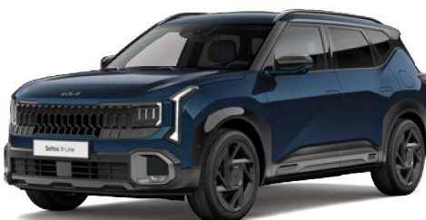
Modrá Gravity (B4U) Perleťová