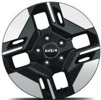
16" hliníkové disky kol s pneumatikami 205/65