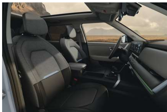
Čalounění v kombinaci látky a umělé kůže (OVG)