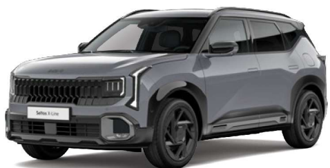
Šedá Steel (KLG) Metalická