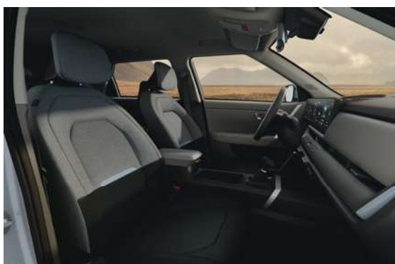
Látkové čalounění šedo černé (OVG)