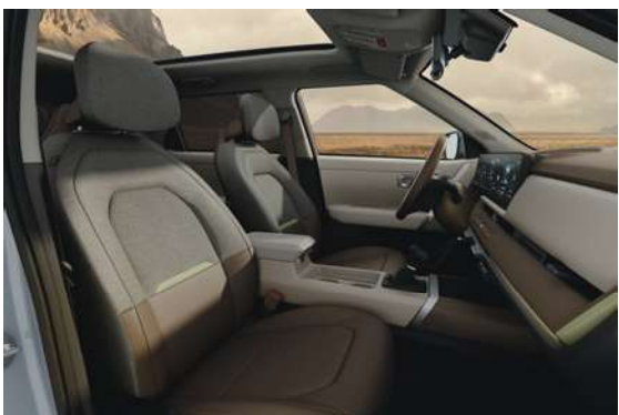
Čalounění v kombinaci látky a umělé kůže (CTD) Šedo hnědé provedení