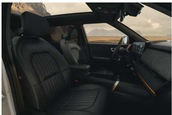
Čalounění v černé umělé kůži (OVS)