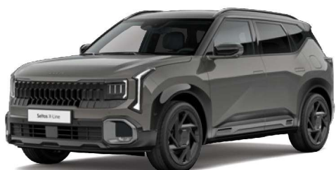
Hnědá Volcanic Sand (BN4) Perleťová