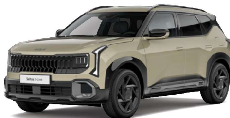
Béžová Tan (TAM) Pastelová