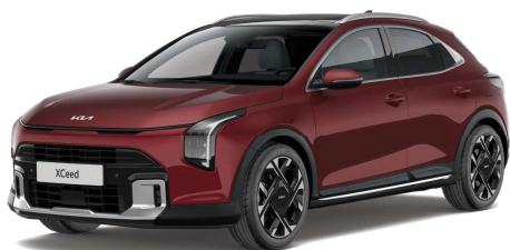
Červená Magma (ARD) Metalíza