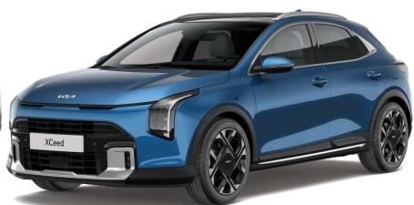
Modrá Flame (B3L) Metalíza