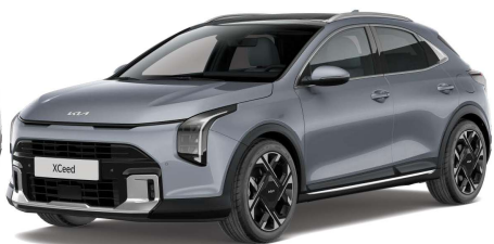
Stříbrná Lunar (CSS) Metalíza