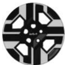
16" disky a pneumatikami 205/60R16 Comfort SPIN Exclusive