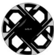
18" disky a pneumatikami 235/45R18 TOP