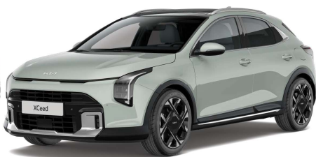
Morning Haze (DM8) Pastelová