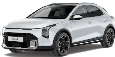
Perleťová Bílá Deluxe (HW2) Metalíza/perleťová