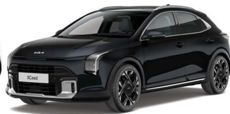
Perleťová Černá (1K) Metalíza/perleťová