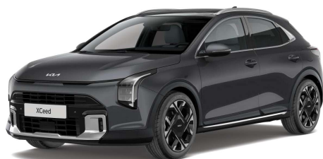
Šedá Penta Metal (H8G) Metalíza