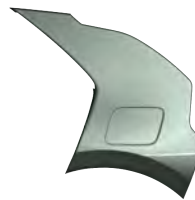
Zelená Cityscape (CGE)