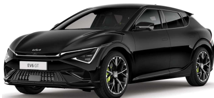
Perleťová černá Aurora (ABP)