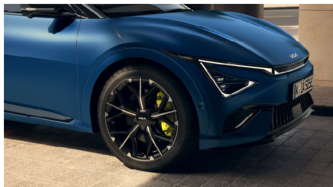
21" slitinový disk GT s pneumatikami 255/40 R21