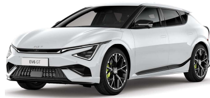
Perleťová bílá Snow (SWP)