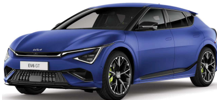
Matná modrá Yacht (DUM)