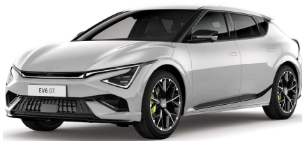
Šedá Wolf (C7S)