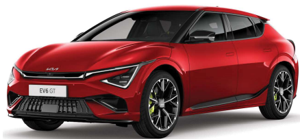
Červená Runway (CR5) Bez příplatku