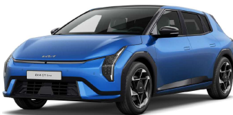
Modrá Blue Flame (B3L)