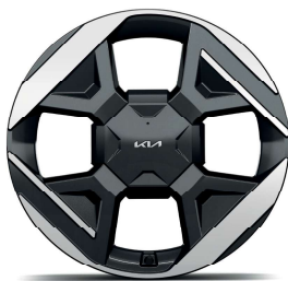
19" slitinový disk s pneumatikami 215/50 R19