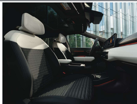
Provedení interiéru GT-Line