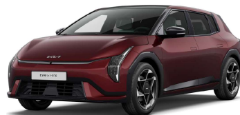
Červená Magma (ARD)