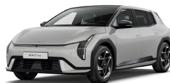
Šedá Wolf (WAF)