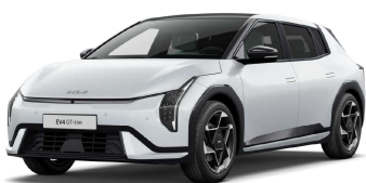
Bílá Deluxe (HW2)