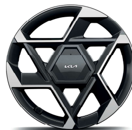
19" slitinový disk s pneumatikami 215/50 R19