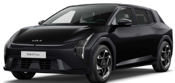
Černá Aurora (1K)