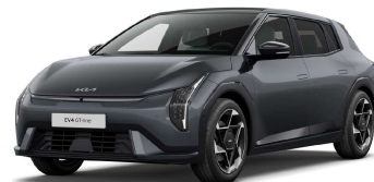
Šedá Penta Metal (H8G)