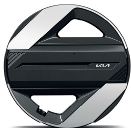
17" slitinový disk s pneumatikami 215/60 R17