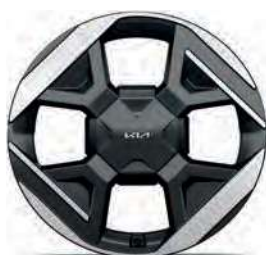
19" slitinový disk s pneumatikami 215/50 R19