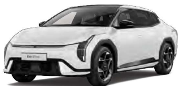
Bílá Clear (UD) Pastelová