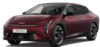
Červená Magma (OVR)