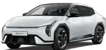
Bílá Snow Pearl (SWP)