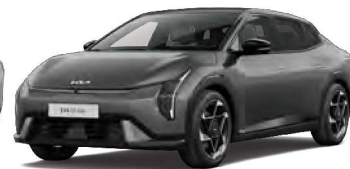
Šedá Shale (EBD)