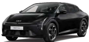
Černá Aurora (ABP)