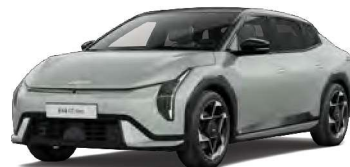
Morning Haze (ACW) Pastelová