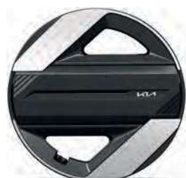
17" slitinový disk s pneumatikami 215/60 R17