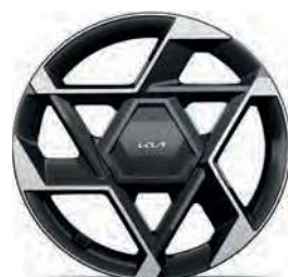
19" slitinový disk s pneumatikami 215/50 R19