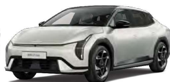
Stříbrná Ivory (ISG)