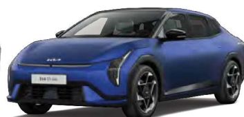
Modrá Yacht (ACY) Matná