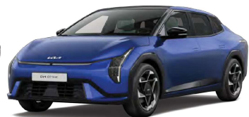
Modrá Yacht (ACX)