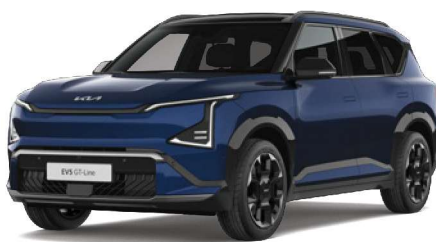
Modrá Dark Ocean (BU3) perleťová