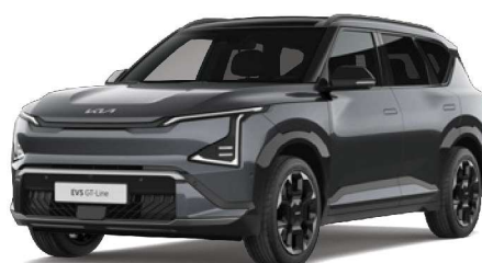
Šedá Gravity (KDG) perleťová metalíza