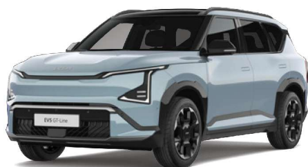
Modrá Frost (EBB) Pastelová - bez příplatku