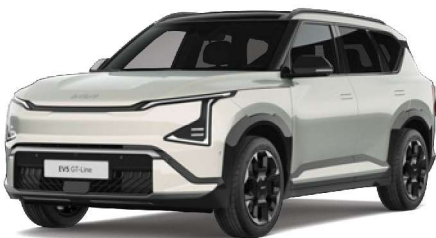
Stříbrná Ivory (ISG) perleťová