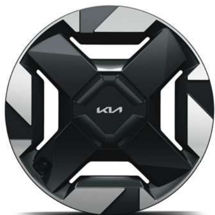
18" slitinový disk s pneumatikami 235/60 R18 (A-Type)