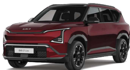
Červená Magma (OVR) perleťová