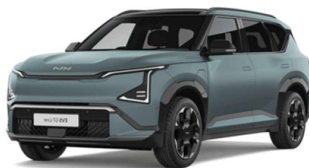
Zelená Iceberg (IEB) matná