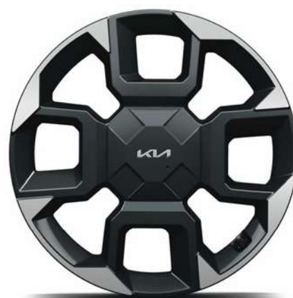
19" slitinový disk s pneumatikami 235/55 R19 (B-Type)