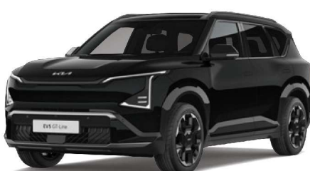
Černá Fusion (FSB) perleťová metalíza