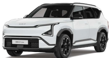
Bílá Snow (SWP) perleťová