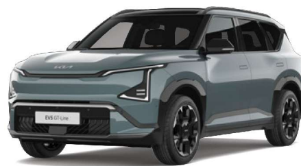
Zelená Iceberg (IEG) perleťová metalíza