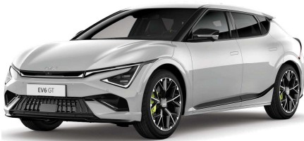
Šedá Wolf (C7S)