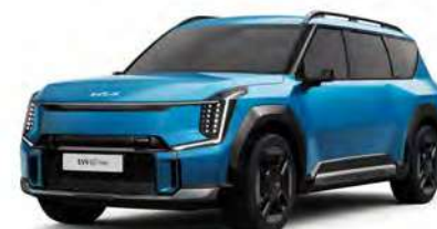
Modrá Ocean - matná (OBM) - dostupné pouze pro GT-Line