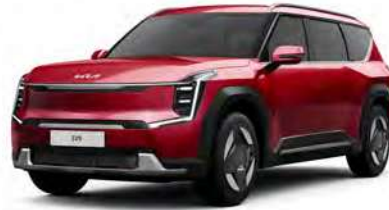
Červená Flare (C7R)