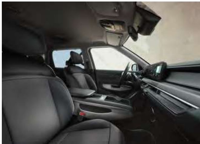
Tmavý interiér (veganská kůže) - standardně pro Air