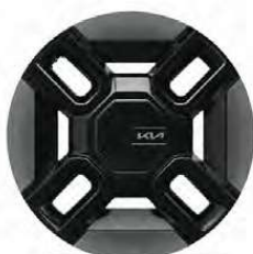
21" hliníkové disky kol s pneumatikami 285/45 R21