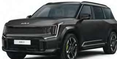
Šedá Panthera Metal - lesklá (P2M) - nedostupné pro Air