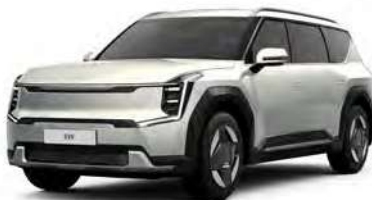
Stříbrná Ivory - lesklá (ISG)