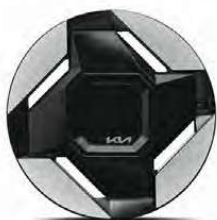
19" hliníkové disky kol s pneumatikami 255/60 R19