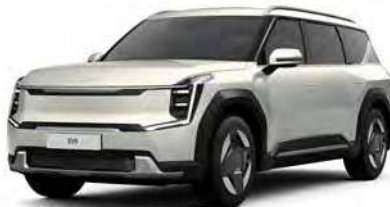
Stříbrná Ivory - matná (ISM) - nedostupné pro Air