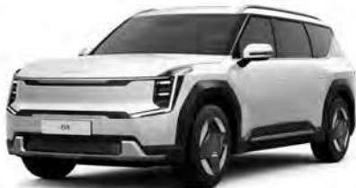
Perleťová Bílá Snow (SWP)