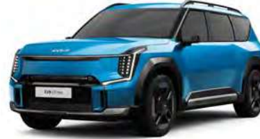
Modrá Ocean - lesklá (OBG) - dostupné pouze pro GT-Line