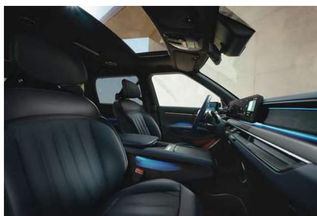
Modrý interiér (veganská kůže) - volitelně pro GT-Line