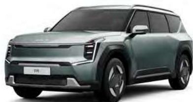
Zelená Iceberg (IEG)