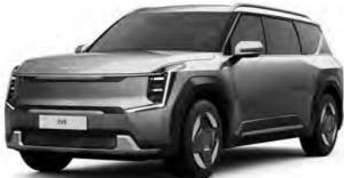
Šedá Pebble (DFG)