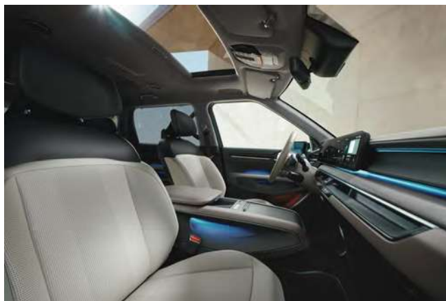
Světlý interiér (veganská kůže) - volitelně pro Earth