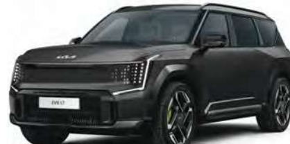
Šedá Panthera Metal - matná (PT9) - nedostupné pro Air