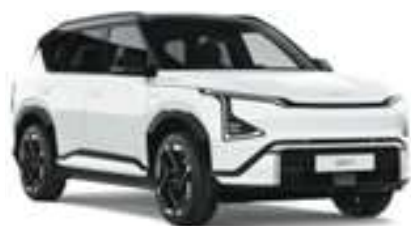
Bílá Snow / Černá Fusion (CAS)