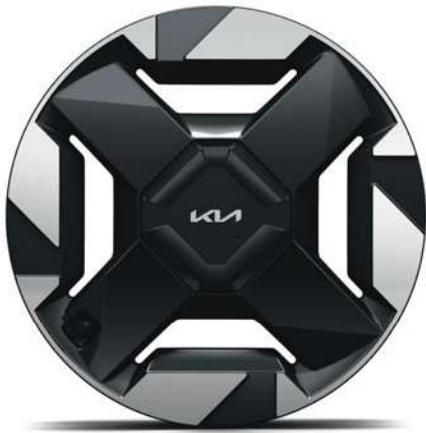
18" slitinový disk s pneumatikami 235/60 R18 (A-Type)