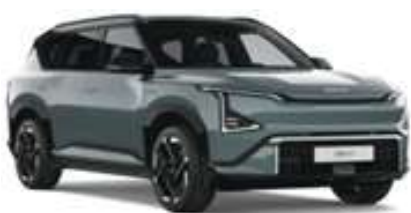
Zelená Iceberg / Černá Fusion (CBG)