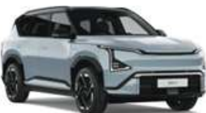
Modrá Frost / Černá Fusion (CBC)