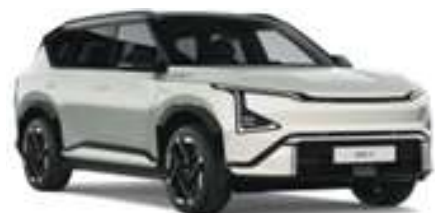
Stříbrná Ivory / Černá Fusion (CAG)