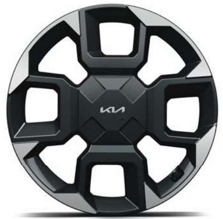
19" slitinový disk s pneumatikami 235/55 R19 (B-Type)