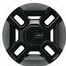
21" hliníkové disky kol s pneumatikami 285/45 R21