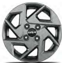
14" kolo z lehké slitiny - příplatkové pro Comfort