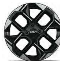
16" kolo z lehké slitiny - GT-Line