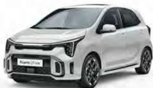
Bílá Clear (UD)