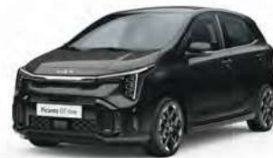
Perleťová černá Aurora (ABP)