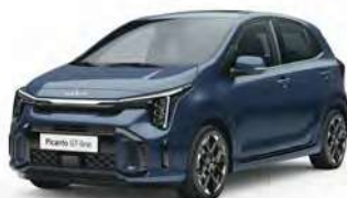
Modrá Smoke (EU3)