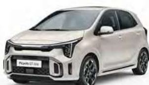
Běžová Milky (M9Y)