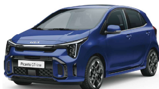
Modrá Yacht (DU3)