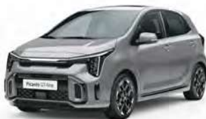
Stříbrná Sparkling (KCS)