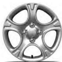
14" kryt ocelového disku - Active - Comfort