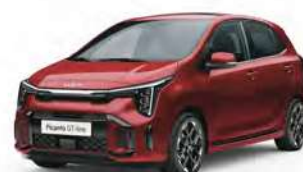
Červená Signal (BEG)