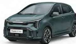
Zelená Adventurous (A2G)