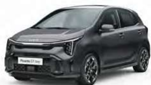
Šedá Astro (M7G)