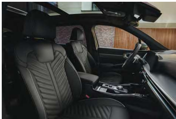
Příplatkové čalounění - pro TOP