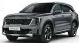
Šedá Steel (KLG)