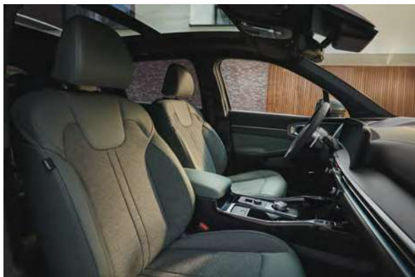
Standardní čalounění - pro Exclusive