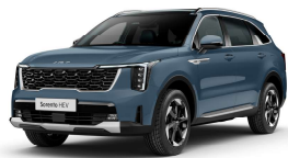
Modrá Denim (DNB) Pastelová