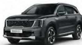
Šedá Interstellar (AGT)