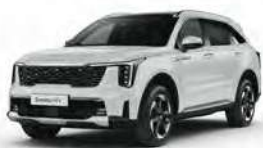
Bílá Clear (UD)