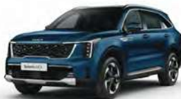
Modrá Mineral (M4B)