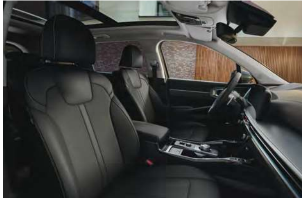
Standardní čalounění - pro Premium, TOP