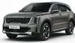
Hnědá Volcanic Sand (BN4)